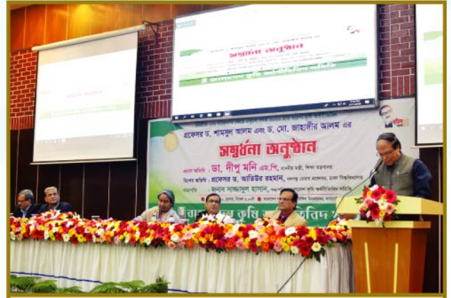
সম্বর্ধনা অনুষ্ঠানে বিশেষ অতিথির বক্তব্য রাখছেন বাংলাদেশ ব্যাংকের সাবেক গভর্নর ও ঢাকা বিশ্ববিদ্যালয়ের বঙ্গবন্ধু চেয়ার অধ্যাপক ড. আতিউর রহমান