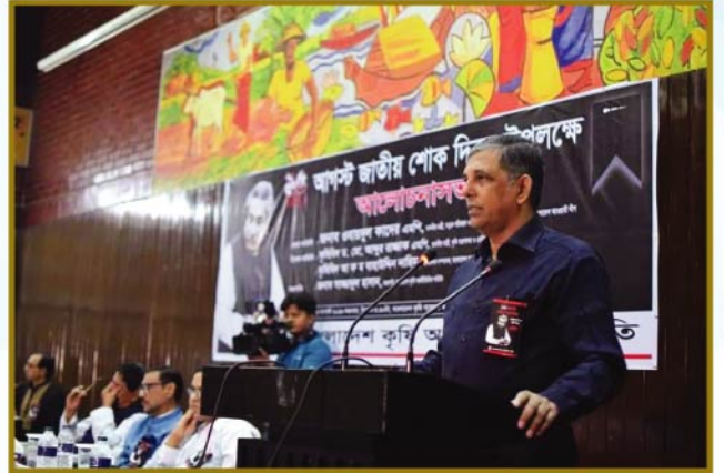
বিশেষ অতিথির বক্তব্য রাখছেন বাংলাদেশ আওয়ামী লীগের যুগ্ম সাধারণ সম্পাদক কৃষিবিদ আ ফ ম বাহাউদ্দিন নাছিম