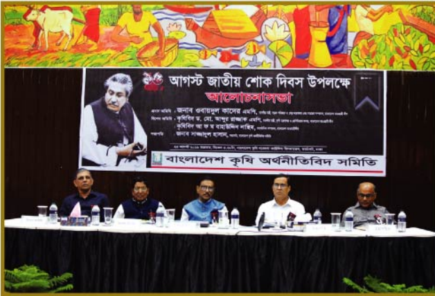
মঞ্চে উপবিষ্ট সম্মানিত অতিথিবৃন্দ