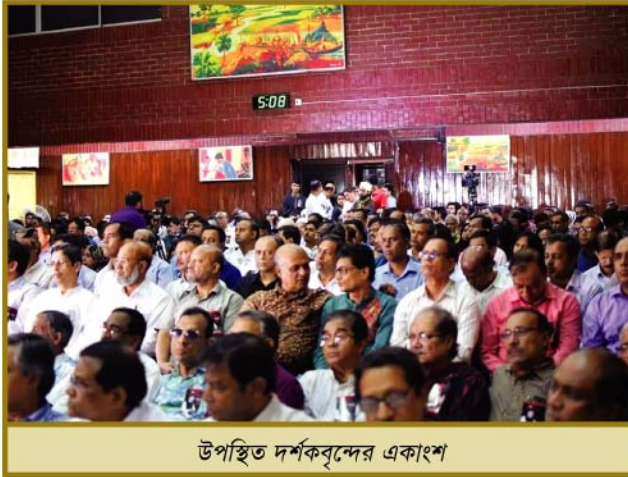
উপস্থিত দর্শকবৃন্দের একাংশ