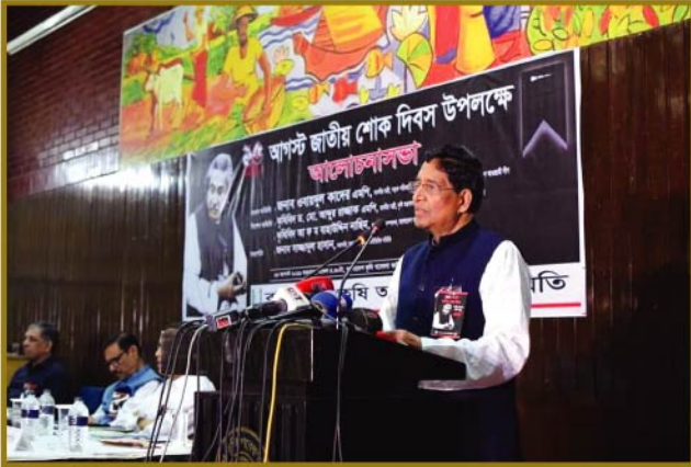
বিশেষ অতিথির বক্তব্য রাখছেন গণপ্রজাতন্ত্রী বাংলাদেশ সরকারের কৃষি মন্ত্রণালয়ের দায়িত্বে নিয়োজিত মাননীয় মন্ত্রী এবং বাংলাদেশ আওয়ামী লীগের প্রেসিডিয়াম সদস্য কৃষিবিদ ড. মো. আব্দুর রাজ্জাক এমপি