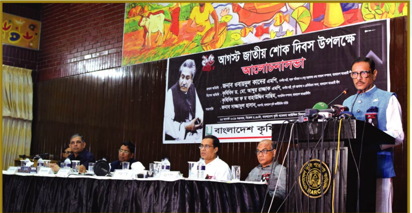
জাতীয় শোক দিবসের আলোচনা সভায় প্রধান অতিথির বক্তব্য রাখছেন গণপ্রজাতন্ত্রী বাংলাদেশ সরকারের সড়ক পরিবহন ও সেতু মন্ত্রণালয়ের দায়িত্বে নিয়োজিত মাননীয় মন্ত্রী এবং বাংলাদেশ আওয়ামী লীগের সাধারণ সম্পাদক জনাব ওবায়দুল কাদের এমপি

১৫ আগস্ট ২০১৯ জাতির পিতা বঙ্গবন্ধু শেখ মুজিবুর রহমান এর ৪৪তম শাহাদত বার্ষিকী ও জাতীয় শোক দিবস। এ উপলক্ষে বাংলাদেশ কৃষি অর্থনীতিবিদ সমিতি ২৩ আগস্ট ২০১৯ শুক্রবার বিকেল ৪.৩০টায় বাংলাদেশ কৃষি গবেষণা কাউন্সিল মিলনায়তন, ফার্মগেট, ঢাকায় এক আলোচনা সভার আয়োজন করে। গণপ্রজাতন্ত্রী বাংলাদেশ সরকারের সড়ক পরিবহন ও সেতু মন্ত্রণালয়ের দায়িত্বে নিয়োজিত মাননীয় মন্ত্রী এবং বাংলাদেশ আওয়ামী লীগ এর সম্মানিত সাধারণ সম্পাদক জনাব ওবায়দুল কাদের এমপি জাতীয় শোক দিবসের আলোচনা সভায় প্রধান